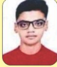
પ્રજાપતિ ઓમ 97.70 (તૃતીય) (494/600)