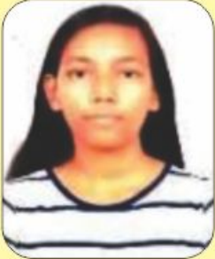
પટેલ કેની 96.10 (પ્રથમ)