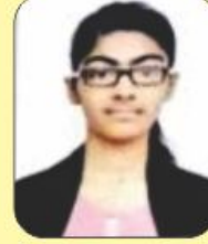
રબારી રીયા 91.64 (પાંચમો) (435/600)