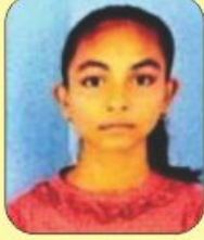
પટેલ આર્ચી 99.98 (દ્વિતીય) (529/600)