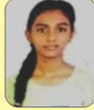
બાવા ખુશી 94.84 (ચતુર્થ) (461/600)